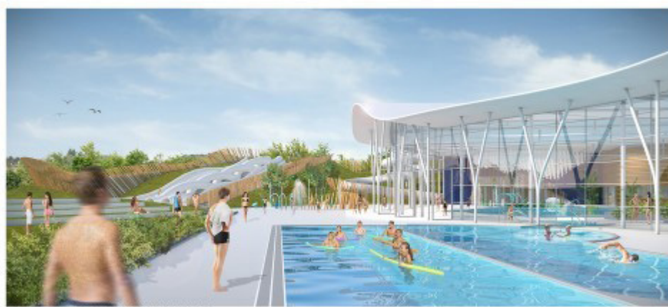
PERSPECTIVE SUR LES ESPACES DE PRATIQUE EXTERIEURS